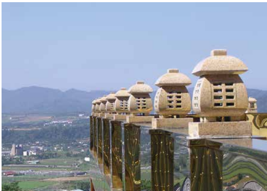
大佛山之美 - 女兒牆

在未法時代，少數出家人寧願違背佛陀所制戒律，行不如法之事，誤導眾多在家人。和尚還是要將正法傳授予大眾，令大眾於正德大佛道場受持八關齋戒，真正於寺廟過著出家一天一夜的生活，方得受戒圓滿之功德。