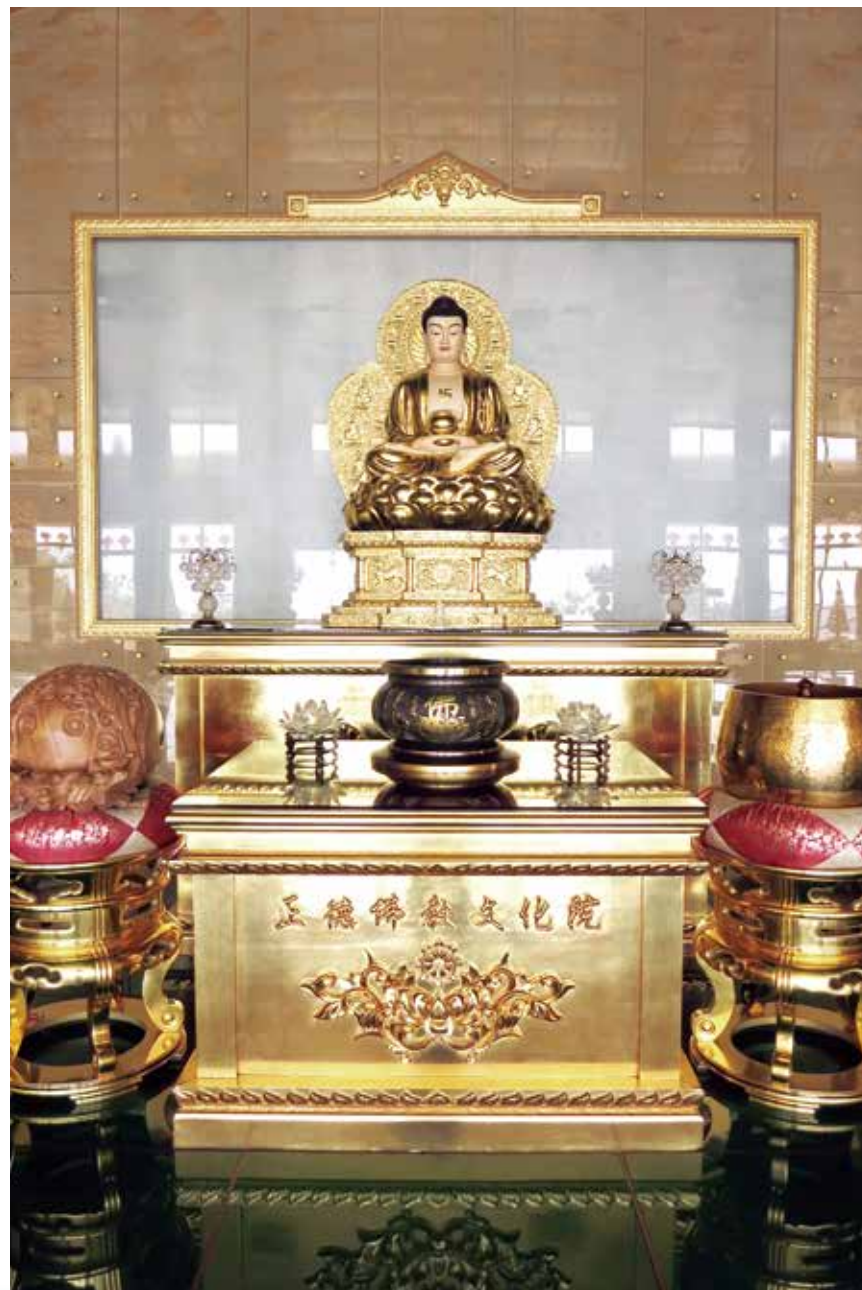
大佛山之美 - 西方化境一景（三寶殿供奉之佛像、安金佛桌）