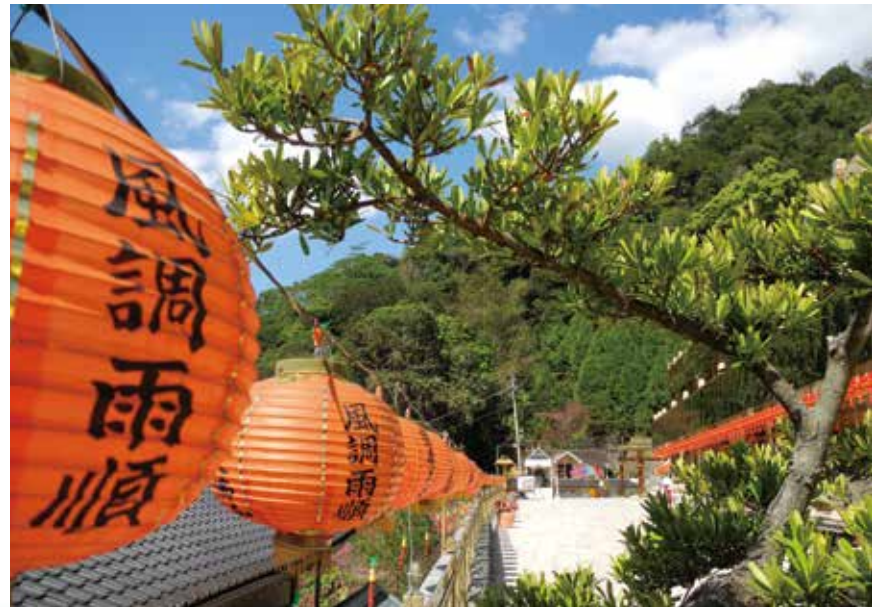
大佛山之美 - 祝福 (國泰民安 · 風調雨順)

若當事者不斷除諸惡、學佛行善，單靠誦經就能解千災、消百難、得諸福，就以邏輯推理或因果論來說，怎麼都不通。