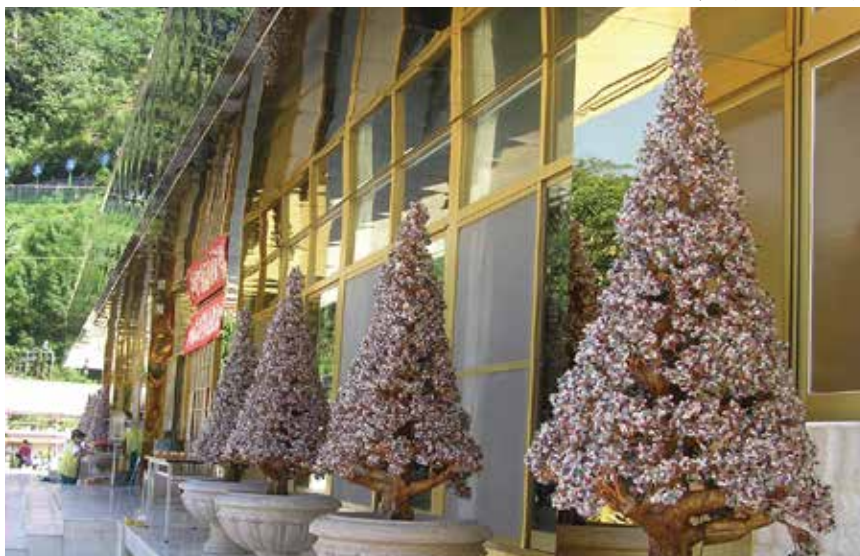
大佛山之美 - 西方化境四景 (七寶琉璃樹)

出家人就如同老師一樣，他要教導你學問，本身學識定要豐富，看經文方能理解佛義，為眾生解文釋義。因為佛經深奧，中文程度差者很難能理解。但現在出家人教育素質都很高，這是好現象；如此可以帶動佛法興盛，教導眾生了悟佛理，實為大眾之福報，值得慶幸。