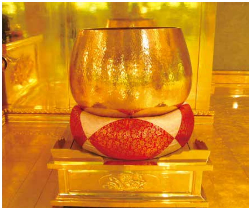
大佛山之美 - 純手工打造的鎏金大磬

一報身，同生極樂國。」學佛的好處，就是隨時可作功德迴向，與眾生結善緣，方便非常，而且真正「為善不欲人知」。相信靠大家的虔誠心，絕對可得佛菩薩加被護佑，令災難消除，平安吉祥。