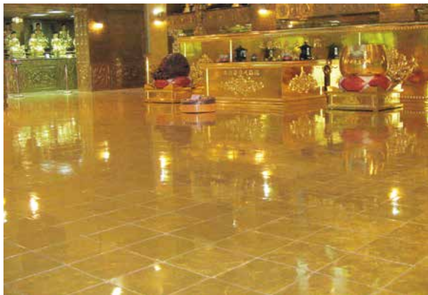
大佛山之美 - 西方化境九景 (大雄寶殿黃金鋪地)

佛制戒律很清楚，出家人無論弘法利生，絕對不能向在家人收取一毛錢。出家是修道人，不是商人。任何一分錢都是在家人捐的血汗錢，不可用之營利謀生，否則犯戒。恩將利報，要下地獄的。這個戒律，佛訂得如此詳細清楚，為何出家人偏偏要犯此大戒？僧人與在家人談錢，有失僧格，根本無法利益大眾。這是什麼因果道理，我實在是想不通，佛教若要衰敗，也不應衰敗到這種程度吧！