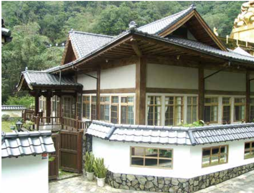
大佛山之美 - 幽靜（仿唐式建築寮房）

師父到過無數在家弟子的家庭，至今幾乎未有人能通過和尚的保守檢驗標準，只有一人能通過檢驗標準，就是文化界名人「儂儂雜誌董事長，吳麗萍居士」的居家環境。大家要好好檢討，請以你愛護重視自己外表之心，來共同美化愛護公共環境衛生，台灣方稱是個美麗的寶島（Formosa）。若能如此，則處處是莊嚴的淨土；所謂心淨，則國土淨。希望大家一起努力共同來營造美麗清淨的淨土，而不是往生後，方能居住的西方淨土。