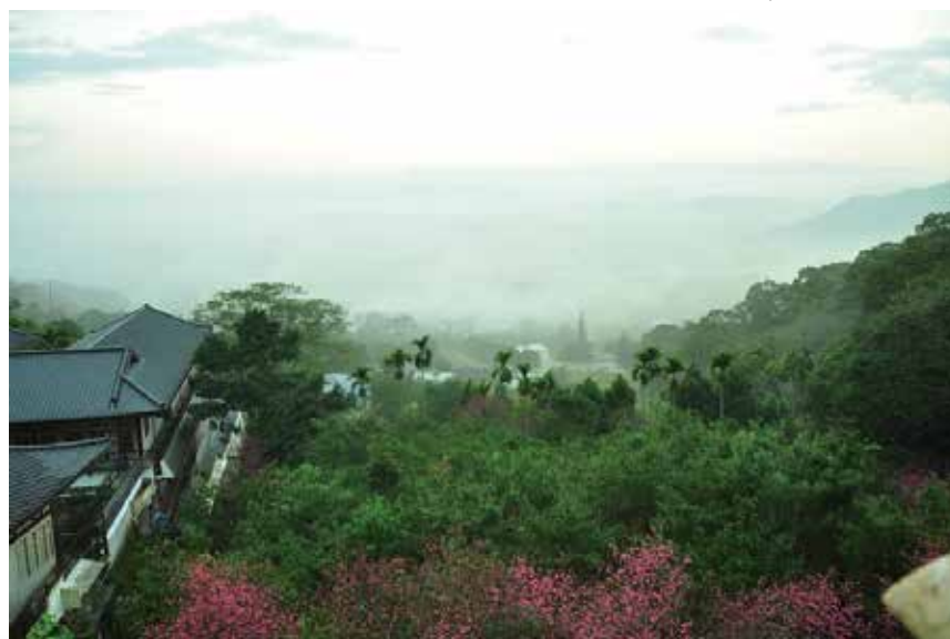
大佛山之美 - 藏美（冬季櫻花景）

今日我們皈依佛，是皈依釋迦牟尼佛，並非皈依過去的一切佛。身為佛陀的弟子，更要學習佛陀偉大的精神，這才能真正展現慈悲與智慧。雖然我們的德行不及佛陀，但也應習得佛陀十分之一的精神，方不負佛陀慈悲苦勞之教化。