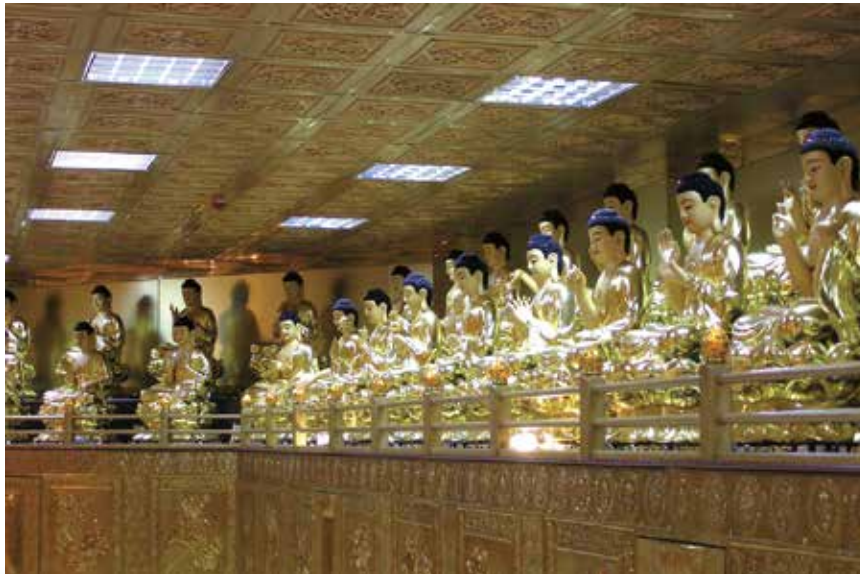
大佛山之美 - 八十八佛（全世界首見整組八十八佛鑄金銅像）

當國人多造諸惡業之時，當累積一股強大業力及三股怨氣停滯台灣天空。若持續惡化，則天將降大災於民，以致民不聊生，受苦無量。此因果真相，期望大家要明悟。人人不造諸惡，多行善事，方是救國救民的根本之道。