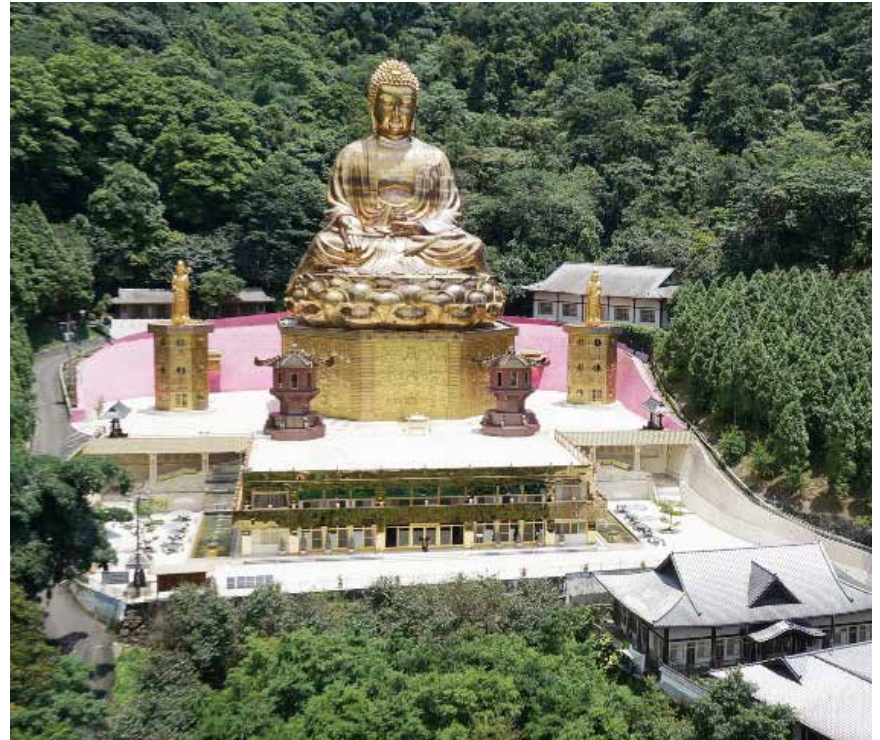
大佛山之美 - 莊嚴（大佛山全景）

教高深的智慧授予美國大眾。更可融合美國的科技、醫學，使美國永遠能為世界和平與自由擔起重任，讓世界更加祥和、光明。