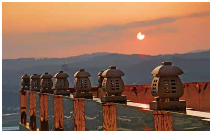
大佛山之美 - 西方化境七景 (大佛山廣場鈦金板鍍金製女兒牆)

以佛教對精神病患的治癒率，絕對遠超過榮格的治療法，是不容置疑的事實。但治療精神病的成果，向來不被媒體所青睞，甚至不予報導。