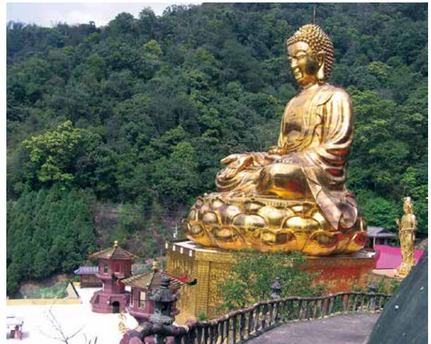
大佛山之美 - 接引 (鎏金大佛 - 阿彌陀佛)