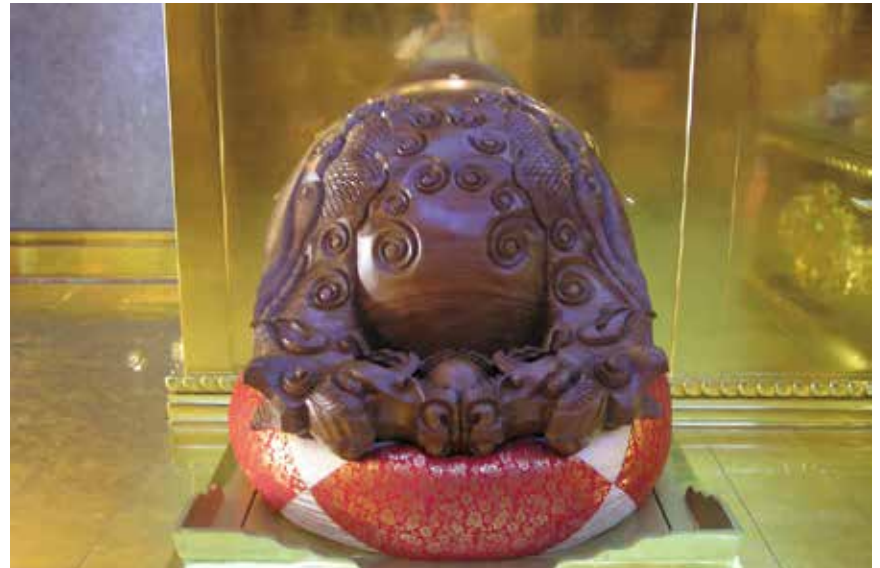
大佛山之美-鎮殿之寶(三百年的牛樟木魚)

無益，亦即無關解脫煩惱的語言與事情。要深知一個人的言行舉止與內心修養成正比，亦即語言是我們內心的一面放大鏡。