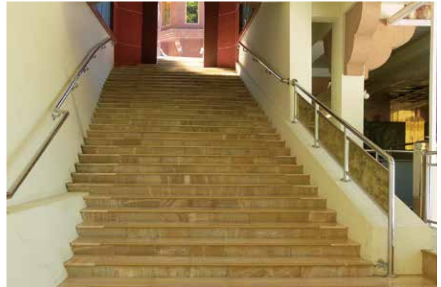
大佛山之美 - 西方化境六景（黃金玉石鋪地）

所以，和尚仍用這種嚴師之心來對待弟子，希望在修行路上，大家皆成為有用的人，以後皆能往生西方世界。和尚如此嚴格對待大家，完全是為了你們好；只有無用之人，才不堪接受和尚嚴格的教化。