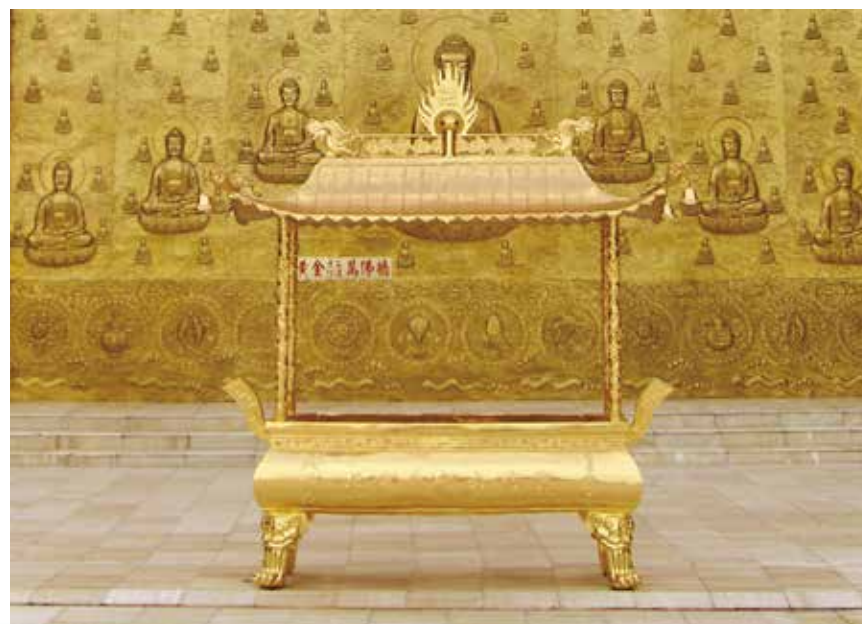
大佛山之美 - 天下第一金爐

和尚鼓勵大眾能稟持菩薩精神，發菩提心於埔里大佛山出家修行，共同累積更多出家人的功德能量。如此自可感召諸佛菩薩、龍天護法，庇佑台灣國運昌隆、災難消除、民生安樂。此為眾生之福，更是自身累世的大福德！