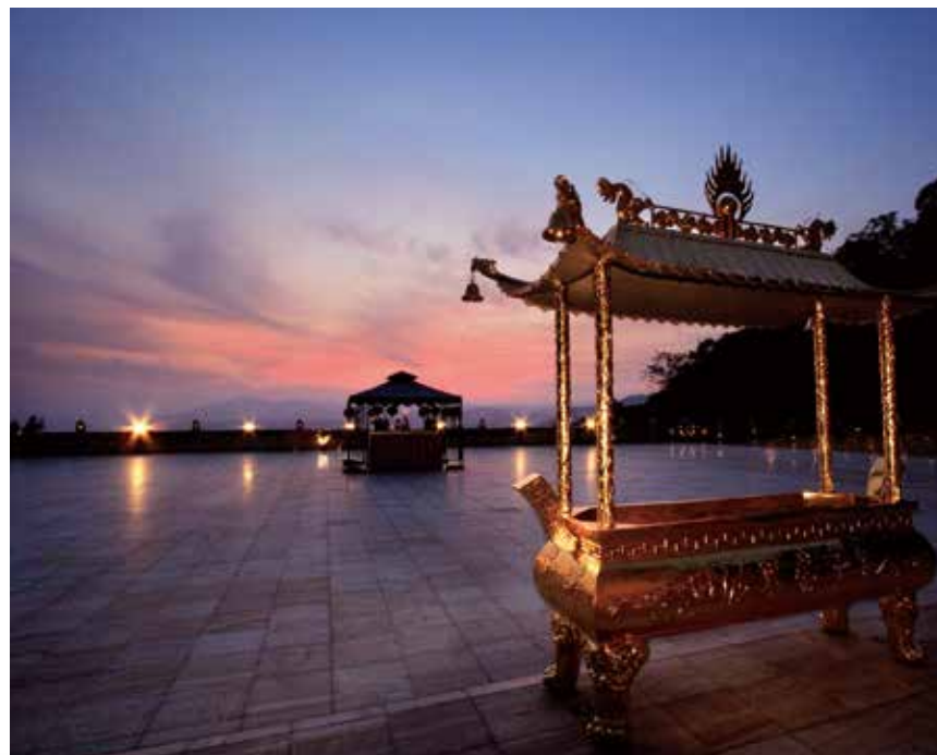
大佛山之美 - 敬天（夕照金爐之美）