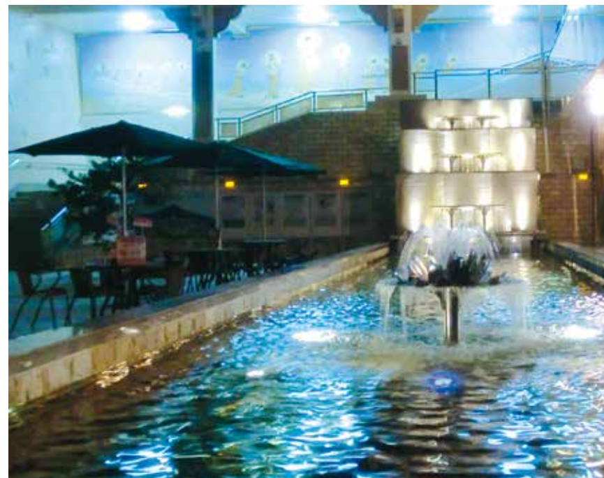
大佛山之美 - 西方化境五景 (七寶池 · 八功德水)

所言：非禮勿視，勿言勿聽。若能如此，自然妄想不生，夜晚就作好夢，甚至無夢，心自清淨，夜晚好入睡。