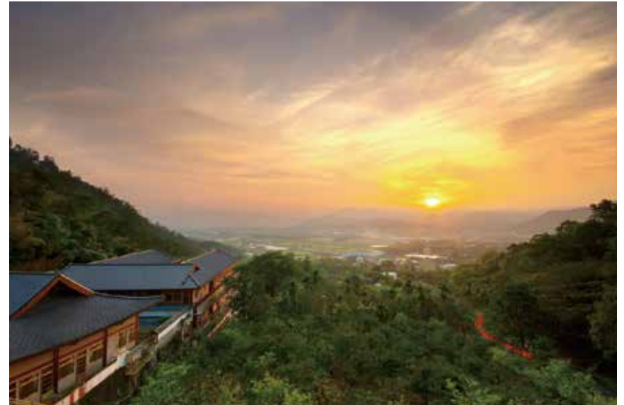
大佛山之美 - 夕照 (仿唐式建築寮房景觀)

試想平民百姓可以住進軍營裡嗎？因軍營是軍人住的地方，百姓不可能住進去。但看天主教及基督教之教堂及修道院，絕不讓一般教徒住進清修。過去，大陸佛教叢林僧眾守戒甚嚴，就連出家雲水僧人，欲至他家佛寺掛單，皆非輕易，如此以防不肖僧人住進而破壞僧眾和合，更何況在家人。