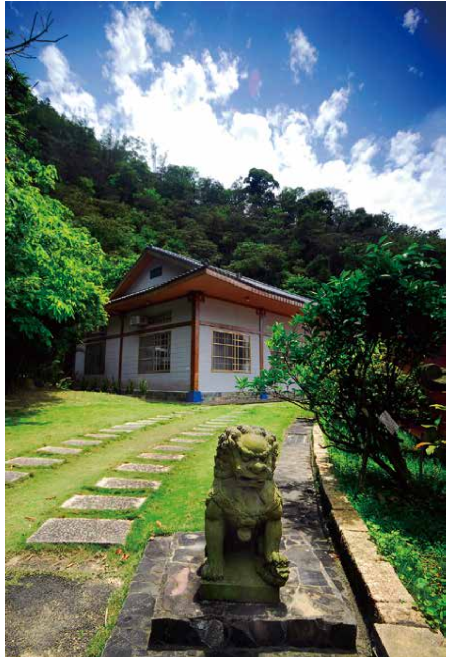
大佛山之美 - 慈孝（地藏殿）