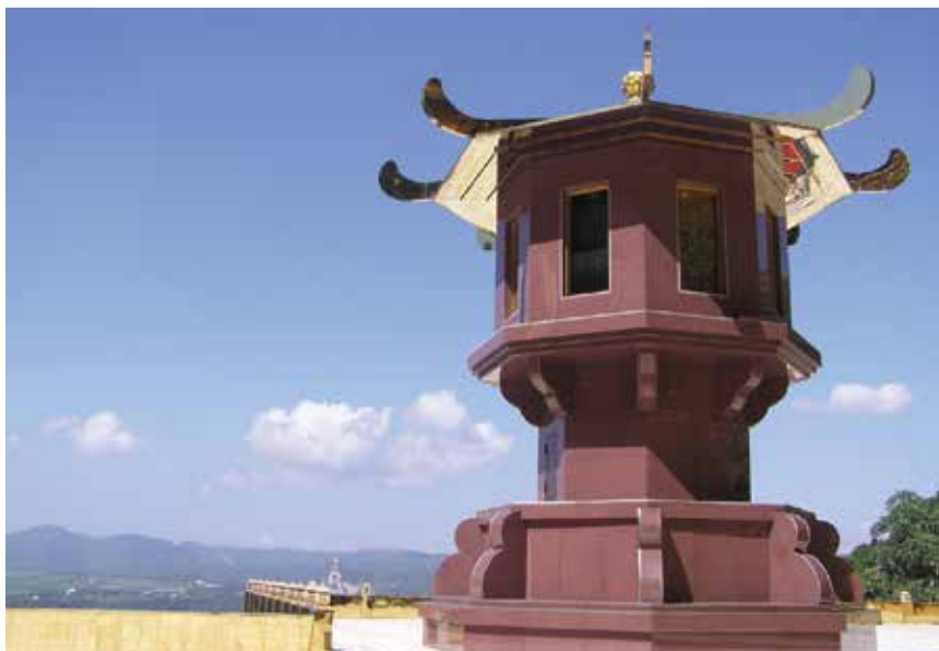
大佛山之美 - 天下第一燈（大佛山廣場佛前燈，3層樓高）

時下佛教界很多自稱大師、活佛者，一再誤導眾生，標榜修行可即刻開悟證果，此無非是自欺欺人。佛說修行無捷徑，快速成佛是魔說。大眾應知，做人要實在，修行更要實在，才能開悟。