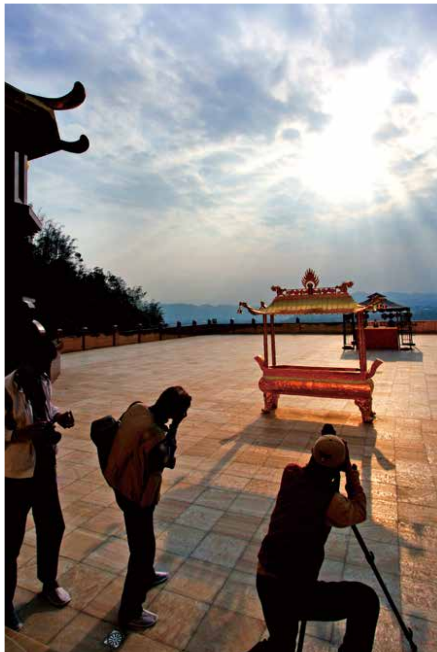
大佛山之美 - 祥光獻瑞 (大佛山廣場)