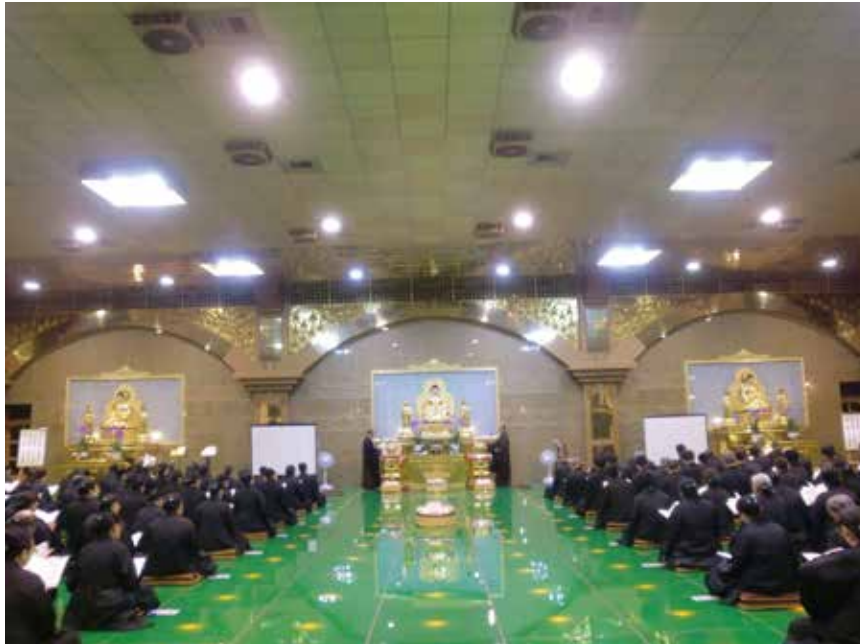
大佛山之美 - 西方化境二景（琉璃鋪地）