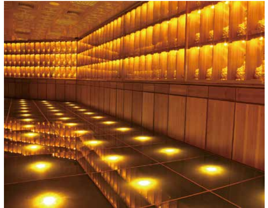
大佛山之美 - 西方化境十景（千佛金身）

一者，處世如器；二者，得善法津澤；三者，離諸渴愛；四者，若渴思水，流泉涌出；五者，終不生於餓鬼道中；六者，得天妙器；七者，遠離惡友；八者，具大福報；九者，命終生天；十者，速證涅槃。