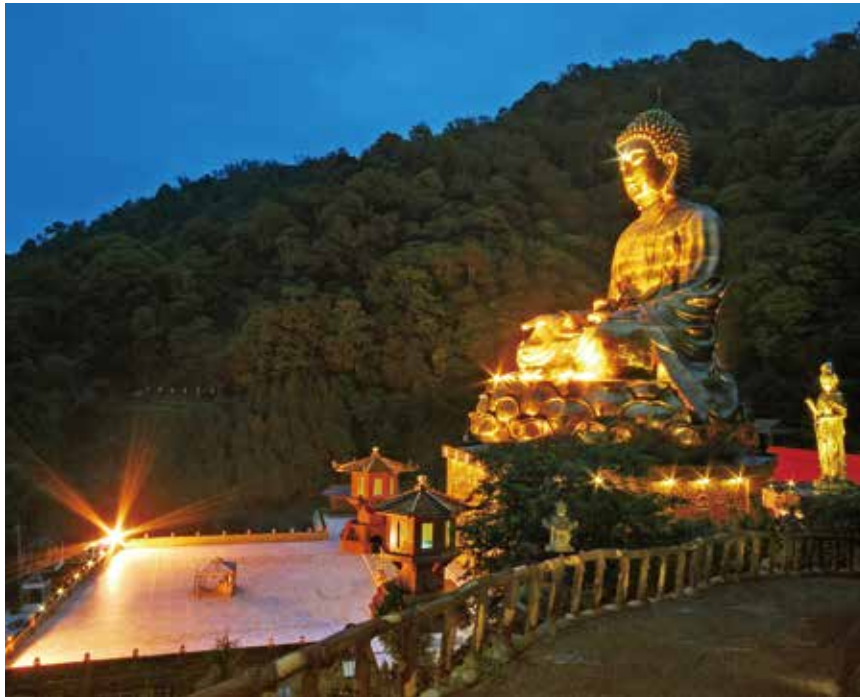
大佛山之美 - 夜色觀佛