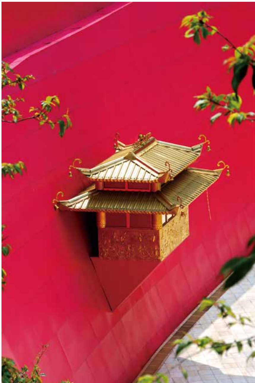
大佛山之美 - 西方化境八景 (空中樓閣)