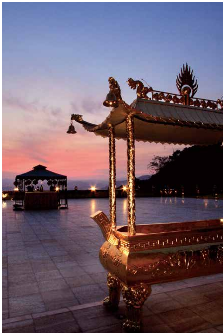
大佛山之美 - 敬天 (金爐之美)