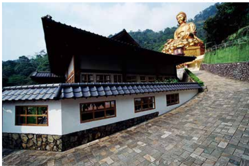
大佛山之美 - 尋道（景觀步道）

最後，和尚再重申一次，女眾當好好遵守戒律，絕不能親近比丘，而比丘也絕對不可親近女眾，這是佛教的大戒；大家要謹守，佛法才會興，正法才會永住。