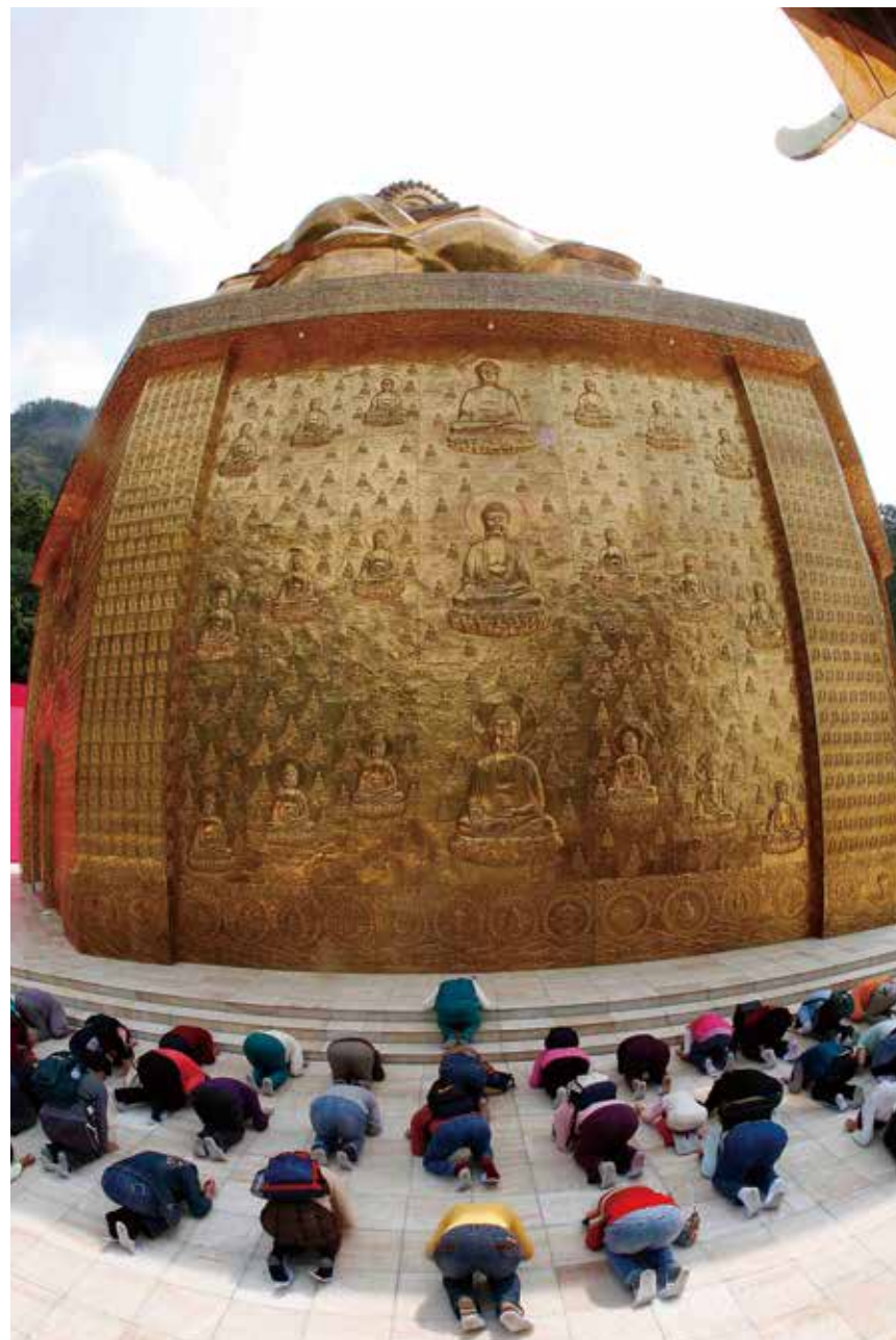
大佛山之美 - 朝禮 (西方化境三景 · 鎏金萬佛牆)