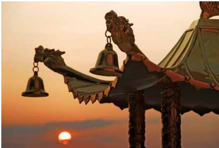
大佛山之美 - 霞光 (大佛山廣場夕照)

我們身為佛弟子每天都要深層反省，一天說了多少不當的話及惡語。我們要改過向善，學佛修心更要修口，方是圓滿。心好者口也好，心惡者口也惡。從未見心好者，會惡言傷人，妄語欺人，挑撥離間，花言巧語。故修好口業，是當佛門志工最基本的條件。